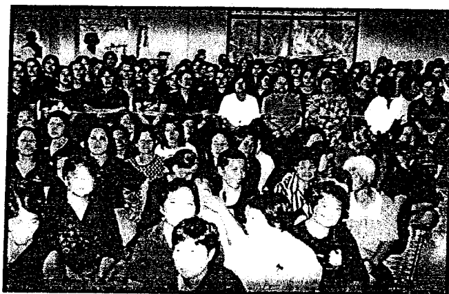
งานสวดพระอภิธรรมศพ