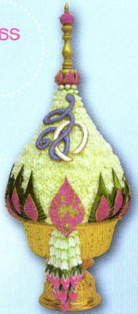
14 พานพุ่มพิจิตรลักษณ์ ขนาดพาน 8 นิ้ว ราคา 2,000.- บาท ค่าจัดส่ง พานละ: 100 บาท (มีจำนวนจำกัด)