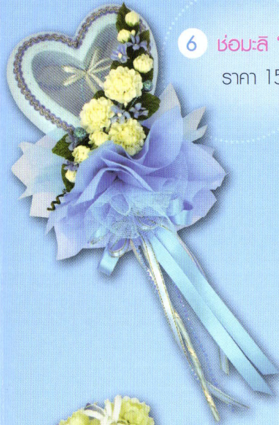
6 ช่อมะลิ "หัวใจรัก" ราคา 150.- บาท