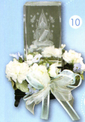
10 แท่งแก้ว "แสงธรรมสว่าง กลางใจลูก" ราคา 399.- บาท เปิดได้พระพรอันดี