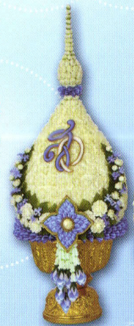
15 พานพุ่มศรีลักษณ์ ขนาดพาน 8 นิ้ว ราคาพานละ: 2,000.- บาท ค่าจัดส่ง พานละ: 100.- บาท