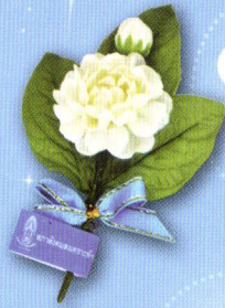
1 ช่อมะลิ "รักแม่" ราคา 10.- บาท