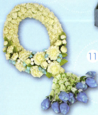
11 มาลัยรัก ขนาด 5 x 12 นิ้ว ราคา 499.- (มีจำนวนจำกัด ไม่จัดส่งทางไปรษณีย์)