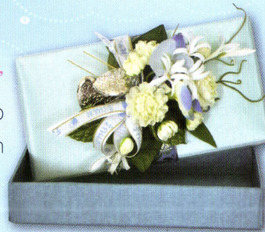
9 กล่อง "ฟ้าใส ใจแม่" ขนาด 4 x 7.5 นิ้ว ราคา 350.- บาท