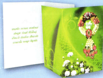
4 บัตรอวยพรแม่ ราคา 20.- บาท