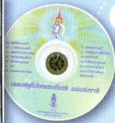
5 ซีดีเพลง วันแม่แห่งชาติ ราคา 100.- บาท (มีจำนวนจำกัด)