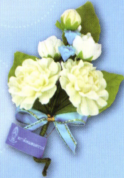
2 ช่อมะลิ "รวมใจรักแม่" ราคา 20.- บาท