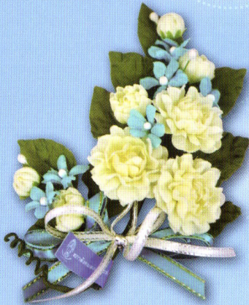
3 ช่อมะลิ "ร้อยรวมรัก" ราคา 50.- บาท