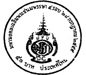
ด้านหลัง