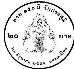
ด้านหลัง