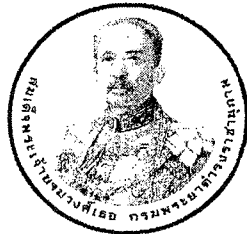
ด้านหน้า

สมเด็จพระเจ้าบรมวงศ์เธอ กรมพระยาดำรงราชานุภาพ ในโอกาสที่วันประสูติครบ ๑๕๐ ปี