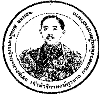
ด้านหน้า