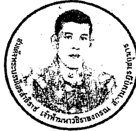
ด้านหน้า