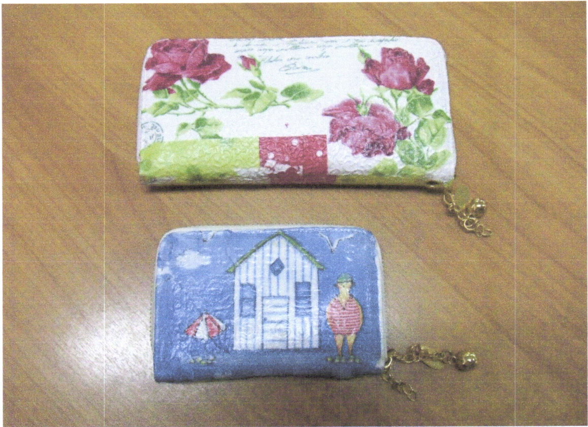
กระเป๋าแบบ เด คู พาจ