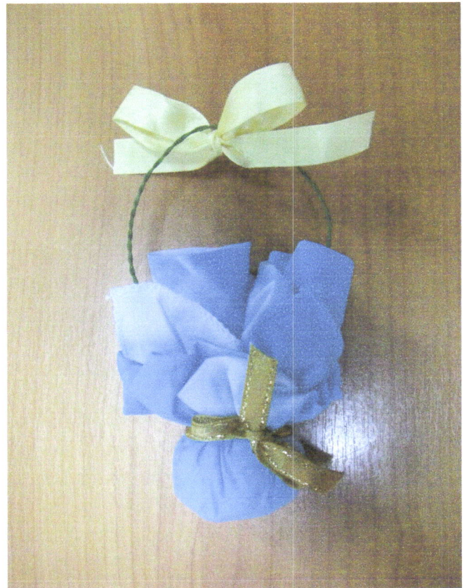
ของชำร่วย