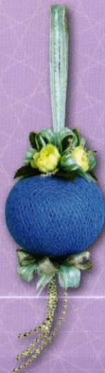
5 โม่บาย...สายใยรัก ราคา 150.- บาท