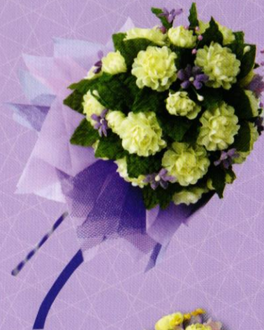
7 ช่อมะลิ...ปัดรัก ราคา 250.- บาท