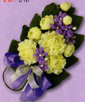
3 ช่อมะลิ “ร้อยรวมรัก” ราคา 50.- บาท