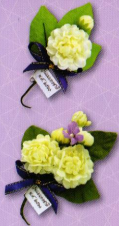
1 ช่อมะลิ “รักแม่” ราคา 10.- บาท