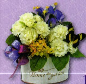
10 แจกกันมะลิบาน...หวานรัก ราคา 320.- บาท