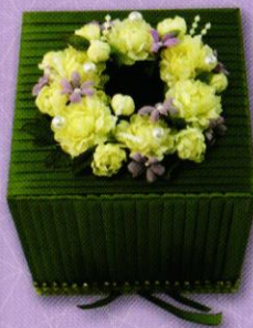
8 กล่องทิชชู...เชียวขจิตวิรัก ราคา 250.- บาท