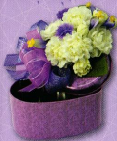
6 กล่องหัวใจใส่รัก ราคา 190.- บาท