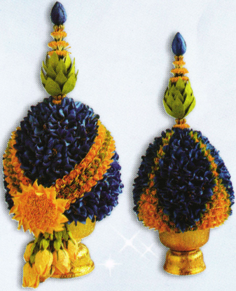
พานพุ่มใหญ่ (22 x 47 ซม.) ราคา 2,500.- บาท