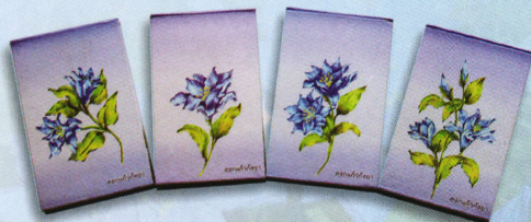
สมุดโน้ตแก้วกลยา (9 x 15 ซม.) ราคา 50.- บาท