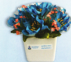
กระถางจิว (10 x 12 ซม.) ราคา 200.- บาท