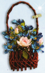
กระเช้าใหญ่ (20 x 28 ซม.) ราคา 450.- บาท