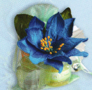
ถุงแก้วกัลยา (พิมพ์เส้น+ยาหม่อง.) ราคา 75.- บาท