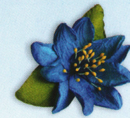
ดอกเดี่ยว ราคา 20.- บาท