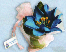
ยาหม่องแก้วกัลยา ราคา 45.- บาท