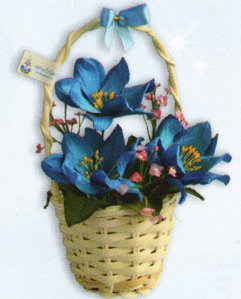
กระเช้าจิว (10 x 14 ซม.) ราคา 120.- บาท