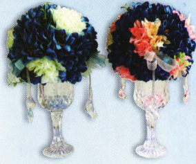
แจกันแก้ว (20 x 30 ซม.) ราคา 1,260.- บาท