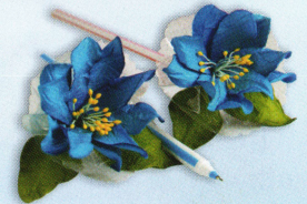
ปากกาแก้วกัลยา ราคา 30.- บาท