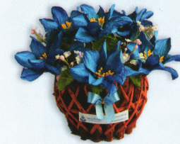
ตะกร้าเล็ก (10 x 12 ซม.) ราคา 200.- บาท