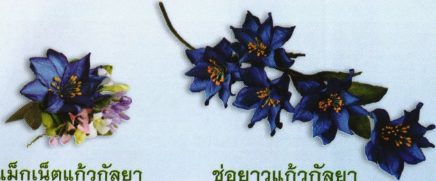
แม็กเน็ตแก้วกลยา ราคา 75.- บาท