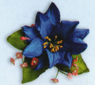
ดอกเดี่ยวมีดอกไม้แซม ราคา 50.- บาท