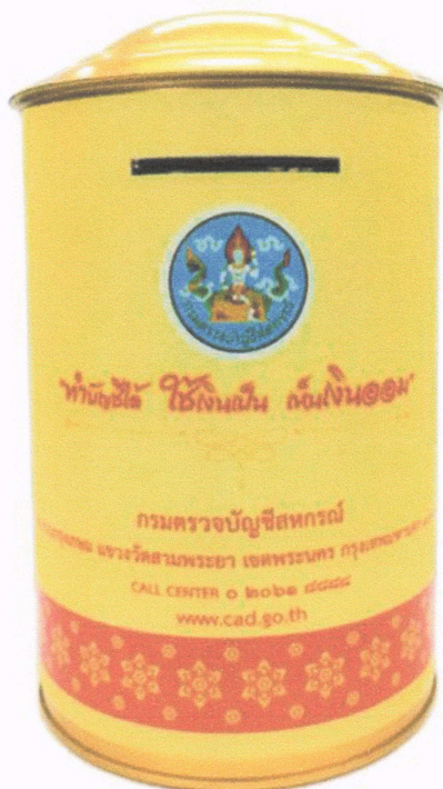
ด้านหลัง