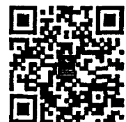
QR Code ส่งหลักฐานการโอนเงิน

โทรศัพท์ ๐ ๒๕๕๑ ๘๑๓๑, ๐ ๒๕๕๑ ๘๑๓๔, ๐ ๒๕๕๑ ๘๑๓๘