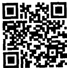
QR Code กรอกข้อมูลใบอนุโมทนาบัตร

และกรุณาส่งสำเนาใบโอน ไปยังฝ่ายบริหารการเงิน สำนักบัญชีและการเงิน องค์การอุตสาหกรรมป่าไม้ เลขที่ ๗๖ อาคารถนนราชดำเนินนอก แขวงวัดโสมนัส เขตป้อมปราบศัตรูพ่าย กรุงเทพมหานคร ๑๐๑๐๐ โทรศัพท์หมายเลข ๐-๒๒๘๒-๓๒๔๓-๗ ต่อ ๑๑๓ โทรสารหมายเลข ๐-๒๒๘๒-๘๘๓๗ หรือกรอกรายละเอียด ผ่านช่องทาง QR-CODE ด้านล่างนี้