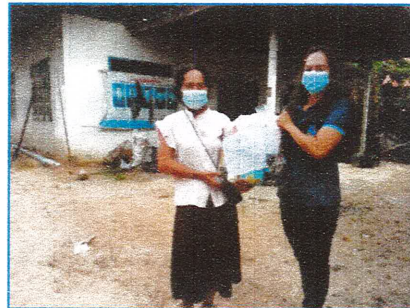
โครงการช่วยเหลือคนพิการจังหวัดศรีสะเกษที่ได้รับผลกระทบจากสถานการณ์การแพร่ระบาดของโรคโควิด -19