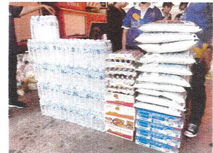
โครงการช่วยเหลือผู้ประสบอุทกภัย น้ำท่วมในพื้นที่จังหวัดศรีสะเกษ