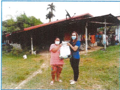
โครงการช่วยเหลือคนพิการจังหวัดศรีสะเกษที่ได้รับผลกระทบจากสถานการณ์การแพร่ระบาดของโรคโควิด -19