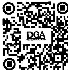
QR Code สำหรับรับชมผ่านทาง Live