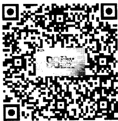
QR Code สำหรับลงทะเบียน

ไปรษณีย์อิเล็กทรอนิกส์สารบรรณกลาง saraban@dga.or.th