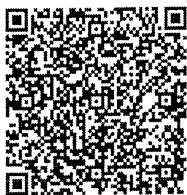
สิ่งที่ส่งมาด้วย ๑

กองระบบการคลังภาครัฐ กลุ่มงานบริการและประชาสัมพันธ์ โทรศัพท์ ๐ ๒๐๓๒ ๒๖๓๖ และ ๐ ๒๒๙๘ ๖๖๖๐ ไปรษณีย์อิเล็กทรอนิกส์ gfmis1@cgd.go.th