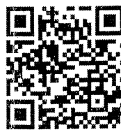
สิ่งที่ส่งมาด้วย ๓