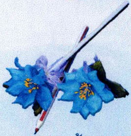
ปากกาแก้วกัลยา