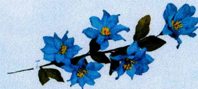
ชื่อยาวแก้วกัลยา