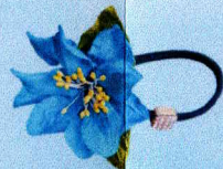
สายรัดข้อมือแก้วกัลยา