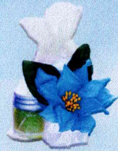
ถุงแก้วกัลยา (ยาหมอง)