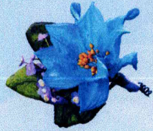
ช่อติดเสื้อแก้วกัลยา (มีดอกไม้แซม)