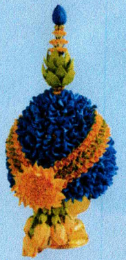
พานพุ่มใหญ่ (22x47 ซม.)