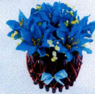
ตะกร้าเล็ก (10x12 ซม.)