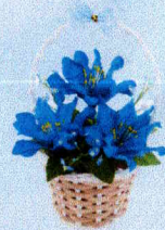
กระเช้าจิ๋ว (10x14 ซม.)