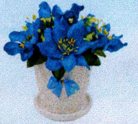
กระถางจิ๋ว (10x12 ซม.)