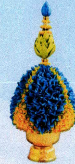
พานพุ่มเล็ก (20x32 ซม.)