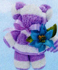
ตุ๊กตาทมิแก้วกัลยา