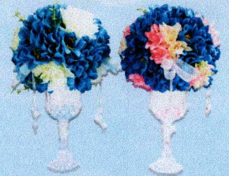
แจกันแก้ว (20x30 ซม.)