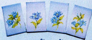
สมุดโน้ตแก้วกัลยา