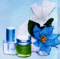
ถุงแก้วกัลยา (ยาหมอง+พิมเสน)