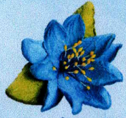
ช่อติดเสื้อแก้วกัลยา (ดอกเดี่ยว)