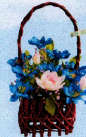
กระเช้าใหญ่ (20x28 ซม.)