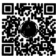
ระบบบูชาฯ

ประธานกรรมการสวัสดิการสำนักงานปลัดกระทรวงเกษตรและสหกรณ์