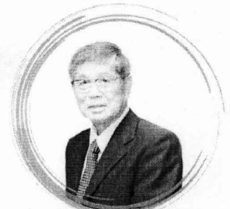
ศ.ดร.ประยงค์ เนตยาภิรักษ์ ผู้ทรงคุณวุฒิ

สอบถามรายละเอียดเพิ่มเติมได้ที่ ฝ่ายส่งเสริมพัฒนาศักยภาพบุคลากรการวิจัย กองส่งเสริมและสนับสนุนการวิจัย และนวัตกรรม สำนักงานการวิจัยแห่งชาติ ☎ 0 2579 1370 - 9 ต่อ 517