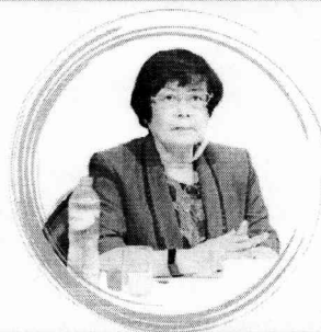
ศ.เกียรติคุณ ดร.บุญเรียง ขจรศิลป์ คณะศึกษาศาสตร์ มหาวิทยาลัยเกษตรศาสตร์