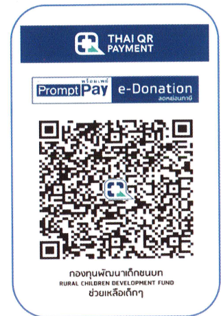
บริจาคผ่าน QR Code (e-Donation)