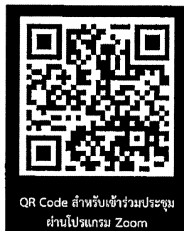
QR Code สำหรับเข้าร่วมประชุม ผ่านโปรแกรม Zoom