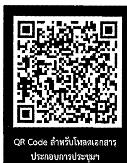
QR Code สำหรับโหลดเอกสาร ประกอบการประชุมฯ