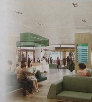
หน่วยตรวจผู้ป่วยนอก