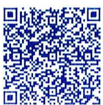
กำหนดการจัดงาน TRIUP Act Fair 2024

สำนักงานคณะกรรมการส่งเสริมวิทยาศาสตร์ วิจัยและนวัตกรรม