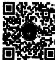
หนังสือ สนร. ที่ นร ๐๑๐๒/ว ๕๙