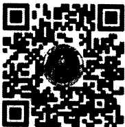
หนังสือ สนร. ที่ นร ๐๑๐๒/ว ๕๗

(นายนวนิตย์ พลเคน) รองปลัดกระทรวงเกษตรและสหกรณ์ ปฏิบัติราชการแทนปลัดกระทรวงเกษตรและสหกรณ์