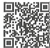
แบบ 2 ลจ.