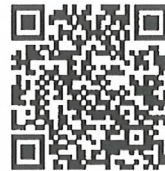
แบบ 2 ชรก.

กองบริหารการเบิกจ่ายเงินเดือน ค่าจ้าง บำเหน็จบำนาญ กลุ่มงานเบิกจ่ายเงินเดือน ค่าจ้าง โทร. ๐ ๒๑๒๗ ๗๐๐๐ ต่อ ๔๕๐๗ ไปรษณีย์อิเล็กทรอนิกส์ disadms4@cgd.go.th