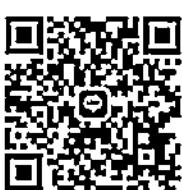
เอกสารแนบ ๓