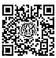
เอกสารแนบ ๒