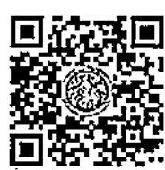
เอกสารแนบ ๑