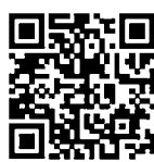
๑. รายละเอียดและกำหนดการ