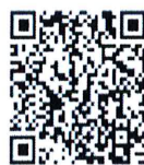
QR-Code ประกาศรับสมัคร

หมายเหตุ : ผู้ที่ไม่มีสิทธิได้รับการเสนอชื่อและได้รับการคัดเลือก : คณะกรรมการสิทธิมนุษยชนแห่งชาติ (กสม.) คณะกรรมการพิจารณาคัดเลือกฯ ประจำปี 2566-2567 และเจ้าหน้าที่ของสำนักงาน กสม.