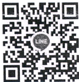
QR CODE สำหรับส่งหลักฐานการโอนเงิน