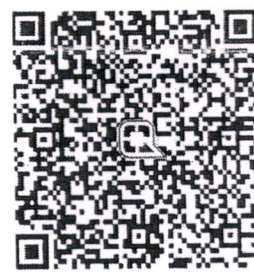
QR CODE สำหรับการโอนเงินบริจาค