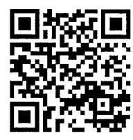
QR Code 2