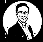
ดร.นิงส์ จามอรุณใจ รองอธิการบดี มหาวิทยาลัยเทคโนโลยีพระจอมเกล้าธนบุรี (จตุ)