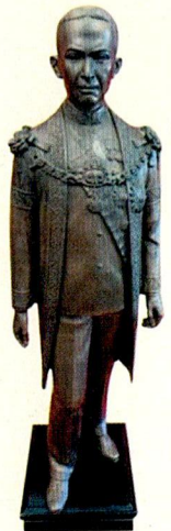
สร้างตามที่สั่งจอง